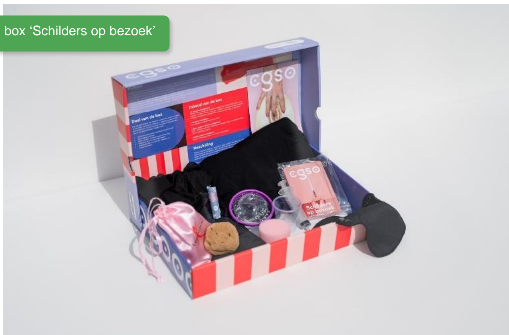
Educatieve box 'Schilders op bezoek'