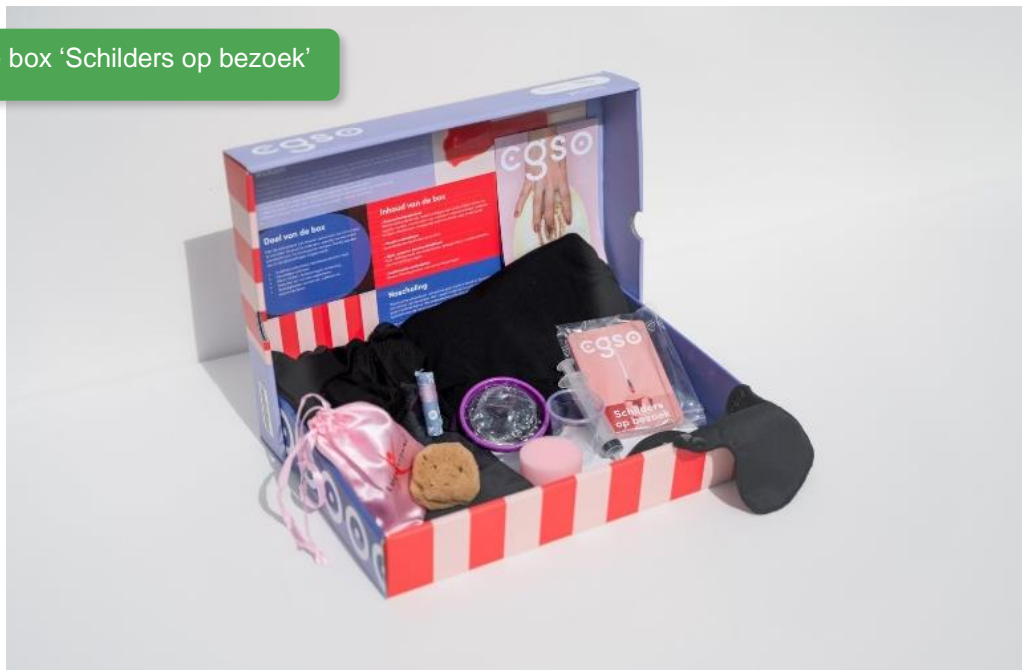
Educatieve box 'Schilders op bezoek'